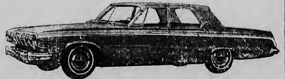
1963 DODGE 440

BEST LOOKING 1963 MOELS - MOST SOLD TOPS IN PERFORMANCE - GUARANTEED SERVICE! SEE THEM AT THE HOME OF THE CHRYSLER FAMILY